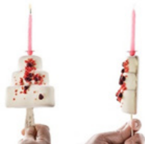
“Polo feliz chocolate blanco” Yogur, frambuesa y chocolate blanco con crispy y bambolas de frambuesa

Todos los precios incluyen el 10% de IVA All prices are inclusive of 10% VAT