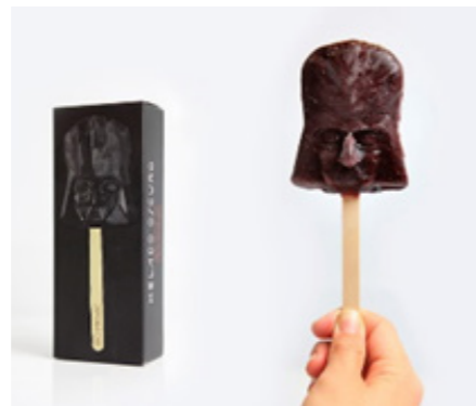
“Helado oscuro” Sorbete de arándanos con vainilla Blueberries and vanilla sorbet