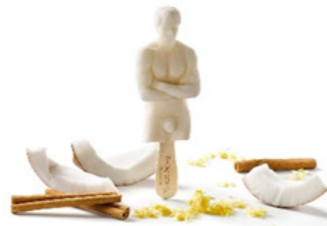
“Velencoco” Leche merengada y coco Meringue milk and coconut