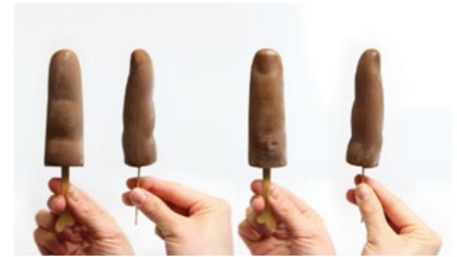
“Dedo de Colón” Sorbete de chocolate, aceite y sal Chocolate, olive oil and salt sorbet