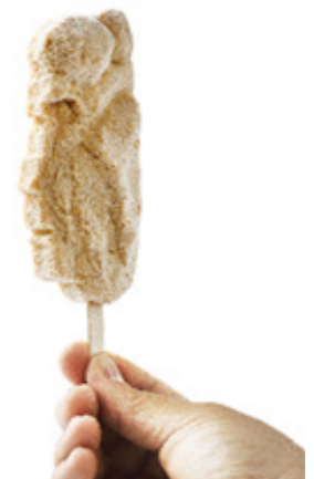
“Cara del moro” Horchata y turrón