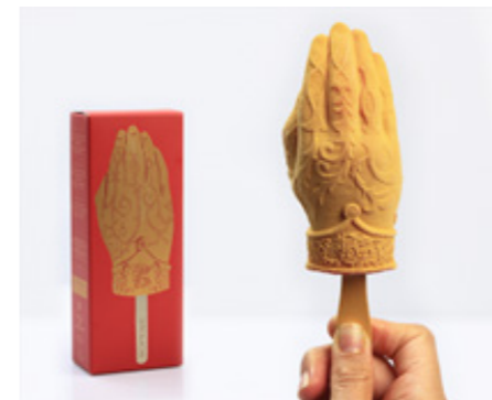
“Mano” Sorbete de naranja sanguina y mango Blood orange and mango sorbet