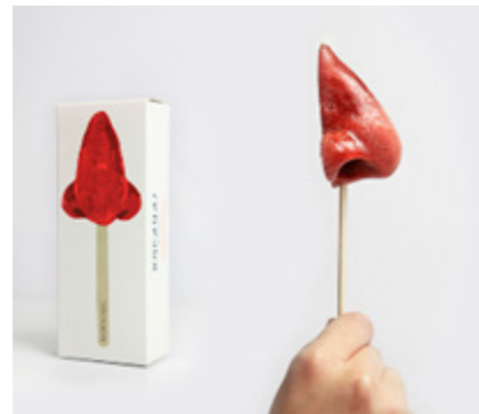
“Rocanàs” Sorbete de fresa con agua de rosa Sorbet of strawberry with rose