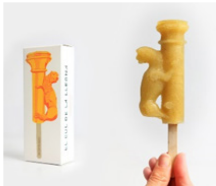
“Culo de la Leona” Sorbete de manzana de Girona y bergamota Apple from Girona and bergamot sorbet