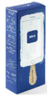
“Icephone” Yogur, regaliz y lima Yoghurt, liquorice and lime