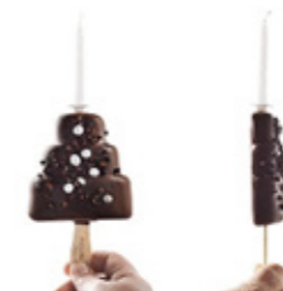
“Polo feliz chocolate con leche” Chocolate con leche y té chai, grue de cacao y bambolas de plátano Milk chocolate and chai tea, cocoa grue and banana nibs