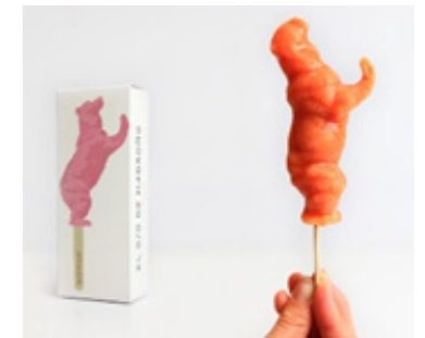
“Oso de madroño” Sorbete de ciruela de arbusto y melocotón